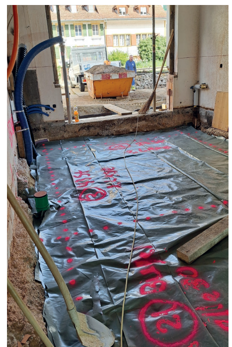
Der neue Eingangsbereich im Erdgeschoss mit Teeküche (links)