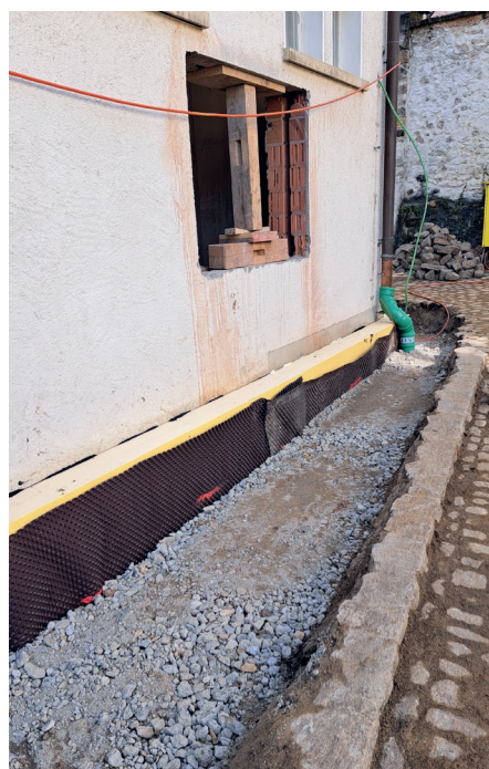
Kanalisationsleitungen werden neu verlegt