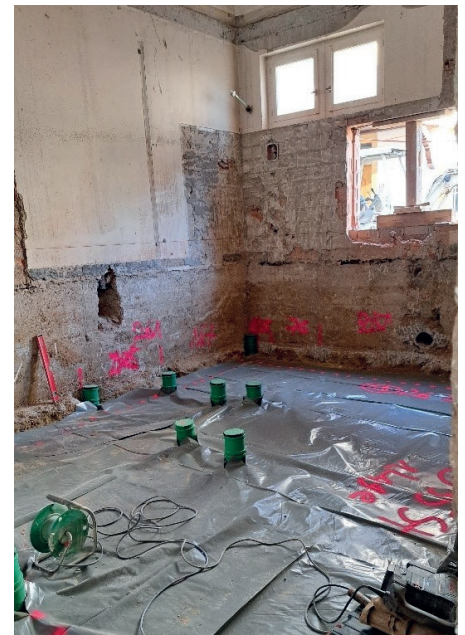
Der Bereich der neuen WC-Anlage im Erdgeschoss